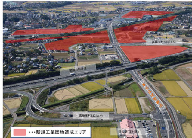
【新規団地造成が進む高崎玉村スマートインターチェンジ周辺】