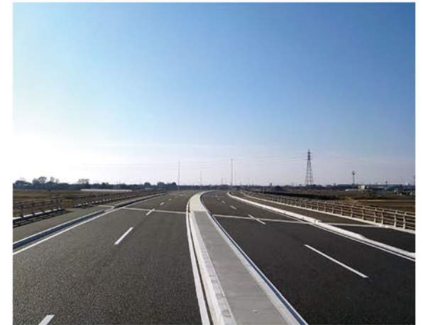
【館林明和バイパス】