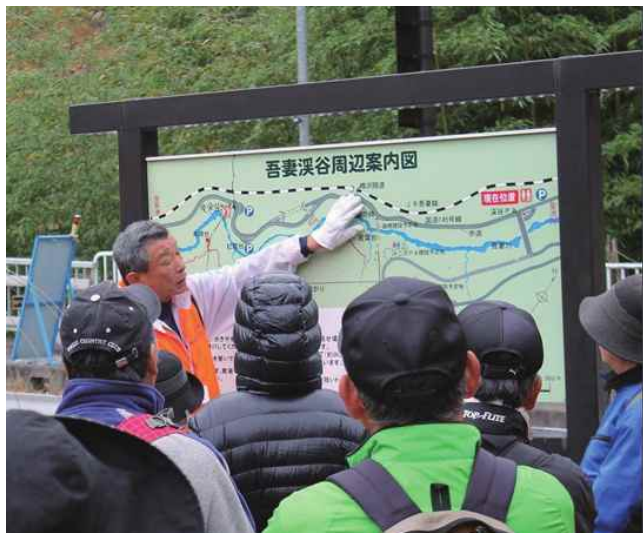
吾妻峡の魅力伝えるシニアボランティアガイド