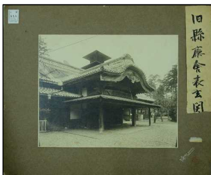
A0181A0B 5437 「旧県庁舎写真」