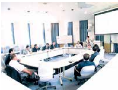
関西学院千里国際中等部・高等部にて

同僚の国際性豊かな特色ある教育内容や学校教育におけるICTを活用した学習等について調査を行いました。