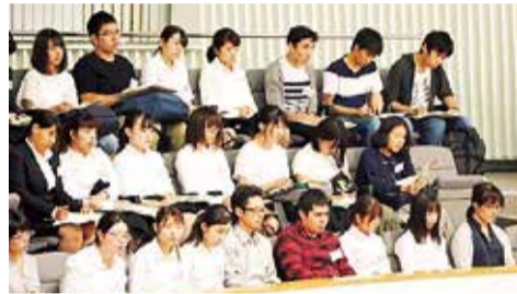
議場内で一般質問のやりとりを傍聴

意見交換を通じて、政治や議員を身近に感じてもらうことに感謝しています。これから、若者の皆さんにも、議員の活動をしっかりとチェックをしていただき、私たち議員も「見られている」という緊張感を常に持って活動していきたいと思えます。