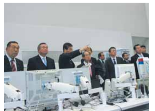
県警通信指令センター

★平成28年1月28日(木) ①群馬県警察本部(前橋市) 現在の指令システムや交通管制システム等、警察本部が担ってきた機能について、その現況を調査しました。