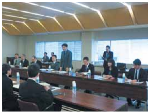
県立女子大学会議室

昨年11月に両大学を公立大学法人化する方針が示され、平成30年度を目標に「1法人2大学」とすることで準備が進められることとなっていることから、今後の公立大学法人化に向けた参考とするため、両大学の現状等について調査しました。