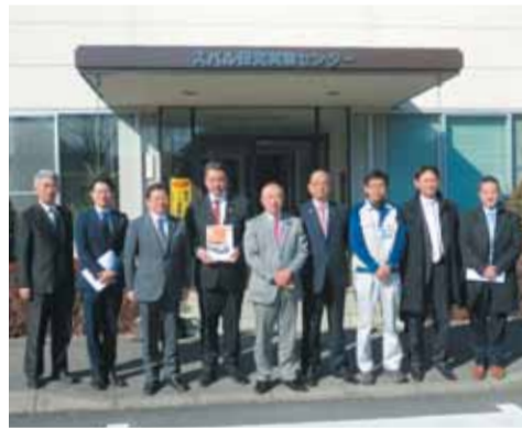
スバル研究実験センター

★平成28年1月28日(木) ①富士重工工業株式会社スバル研究実験センター(栃木県佐野市) 産業振興や交通安全対策等の参考とするため、同社における安全技術等の技術開発の取組について調査しました。