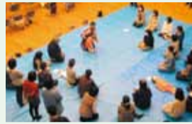
子育て支援のための幼児安全セミナー実技

特別委員会は、県政の特に重要な特定事件を審査するために設置し、議会としての意見・提案をまとめます。