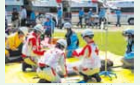
群馬県総合防災訓練