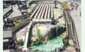
草津温泉・湯畑(草津町)