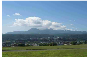
榛名山噴火関連遺跡