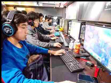
5人 vs 5人のチーム戦