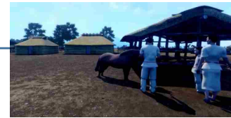
黒井峯遺跡のVR映像