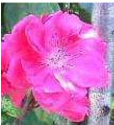
3月の節句でおなじみ「桃の花」

地球温暖化は、二酸化炭素などの温室効果ガスによって引き起こされています。日本人が1年間に出す二酸化炭素の総量は、アメリカ・中国・ロシアに次いで世界第4位です。まずは、私たちから行動を起こしませんか!実行した内容を送付したワークブック付属のはがきに書いて送ってください。認定証と苗木(はなもも)を差し上げます。