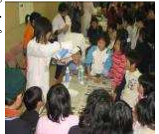
（昨年度の様子より）

各クラブの活動発表、壁新聞の展示など、充実した交流会にしようと思います。沢山のクラブの参加をお待ちしています。