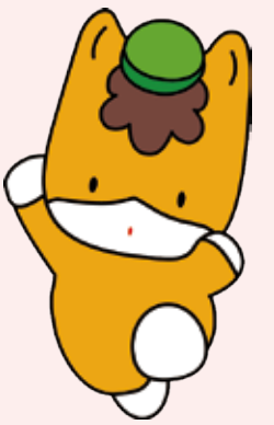
群馬県のマスコット 「ぐんまちゃん」