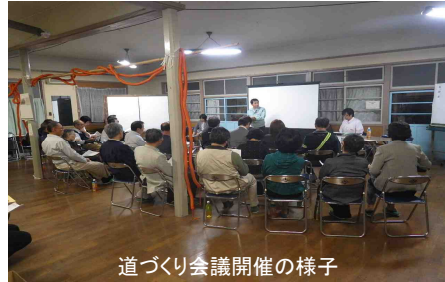
道づくり会議開催の様子

意見交換では、下記のような内容について、出席された方から、ご意見やご不安に思っていることなどのお話がありました。