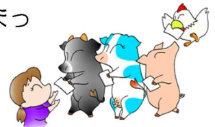
毎年の飼養状況報告

なお、提出されない場合、農場で伝染病が万が一発生してしまった際に迅速な防疫処置がとれない上に、国から交付される手当金について、減額の対象となる場合があります。ご協力よろしくをお願いします。ご協力よろしくをお願いします。