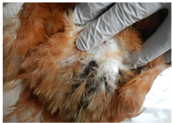
↑鶏の総排泄腔付近に付着したワクモ