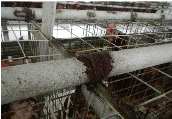
↑ケージ上に付着したワクモの集塊