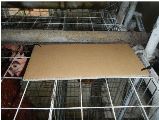
↑ 段ボールトラップ（30cm×15cm）を ゲージ上に設置