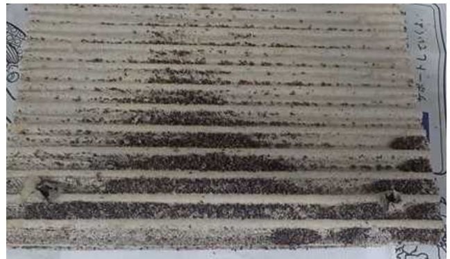
↑ 設置から1週間後の段ボールトラップ内