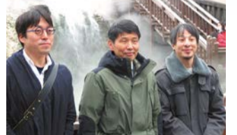
湯畑で記念撮影をするひろゆきさん(右)、成田さん(左)と山本一太知事

3人で草津の名所を巡りながら、群馬県の魅力向上やイメージアップなどの話題で大いに盛り上がりました。群馬県が掲げる「温泉地を生かしたリトリート」や「トップセールスによるロケ誘致」などに関して、さまざまなアドバイスをもらいました。こうした提言を踏まえ、群馬をさらに盛り上げていくための各政策をより一層積極的に進めていきたいと考えています。