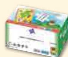
ぐんますく 100枚入り 2,500円 他 ※価格は税込み