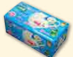
ぐんまちゃん マーク入りマスク 90枚入り 2,500円 他