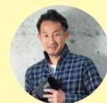
カメラマン ほんだよしきよ 本多義清さん

ツルノプラスの撮影を担当しています。近年はスマートフォンのカメラ機能も充実していますので、コツをつかんで素敵な写真を撮りましょう。