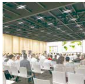
◀学会での利用イメージ