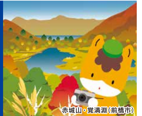
赤城山・覚満淵(前橋市)

県内の紅葉の情報をお知らせしています。 「ググっとぐんま公式サイト」(ググっとぐんま観光宣伝推進協議会ホームページ) https://gunma-dc.net/