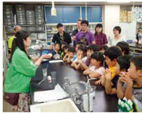
光るスライム作りの様子

日 6月8日、22日、29日(いずれも土曜日) 午後2時~3時(受け付けは1時30分から)