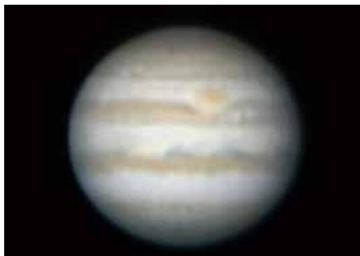
望遠鏡で見られる木星

6月中旬から、木星の見頃がやってきます。木星のしま模様や大赤斑、ガリレオ衛星を大型望遠鏡で観察してみませんか。