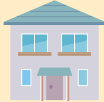
里親・ファミリーホーム宅 児童養護施設