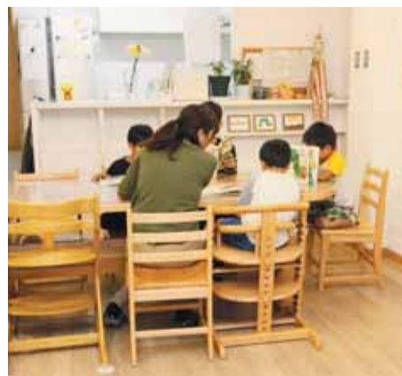
職員と本を読む子どもたち

県では、これらの施設整備に対して補助金を交付したり、職員を増やす場合に人件費を加算したりして、児童養護施設の整備を推進しています。