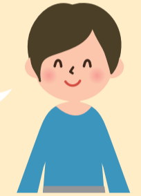
アフターケア事業所 (ヤング・アシスト)