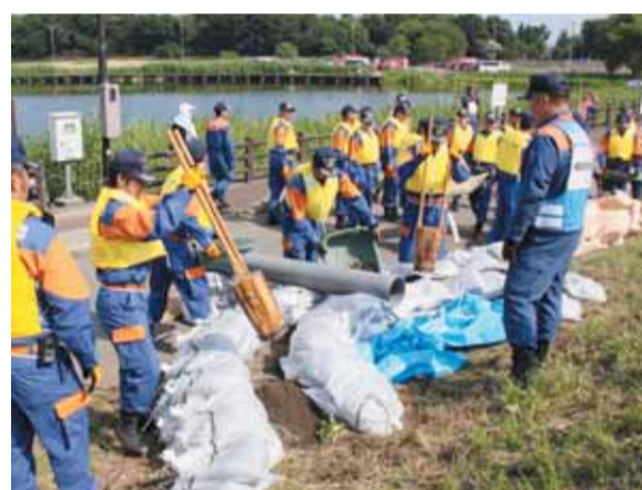
訓練で「月の輪工法」の手順を確認する

「3年前、鬼怒川上流の日光市などで記録的な大雨が降り、下流の茨城県で堤防が決壊しました。もし豪雨をもたらした雨雲が数十キロ西の渡良瀬川上流で発生していたら、下流の館林地区で大きな浸水被害が発生していたかもしれません。」