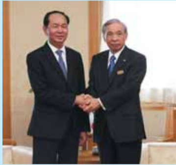
友好を誓い固く握手する、チャン・ダイ・クアンベトナム国家主席(左)と大澤正明知事

国家主席からは「結び付きの深い群馬県を訪問しました。経済交流だけでなく、質の高い人材の育成・交流を促進していきたいです」との話をいただき、ベトナムの大