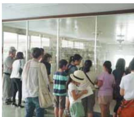
工場を見学する親子

募集 夏休み「食の現場」親子リポート書き方教室&工場見学会 期日 7月27日(金) 時間 午前10時～11時30分 会場 大塚製菓高崎工場(高崎市西横手町) 内容 県内の食品関連事業者が実施している食の安全・安心に関する取り組みについて、親子で理解を深めてもらうため、リポートの書き方教室を開催し、実際に「食の現場公開工場」を見学する親子