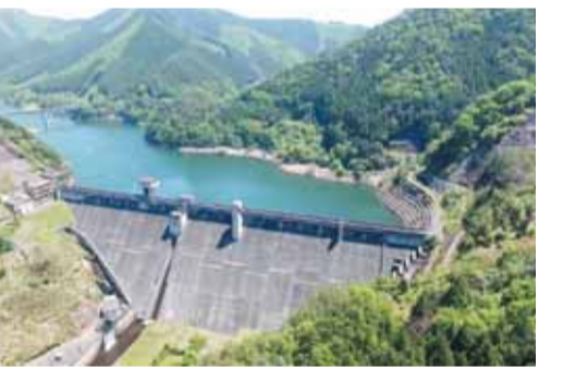
上空から見た桐生川ダム

期日 7月29日(日) 時間 午前10時～午後3時 会場 桐生川ダム(桐生市梅田町) 内容 普段は見られないダム内部の見学 費用 無料 申し込み方法 当日、直接会場にお越しください その他 希望者には「ダムカード」(ダムのことをより知ってもらう目的で作成したカード型パンフレット)を配布します ☎ 県桐生土木事務所 ☎0277-53-0121 ㊼0277-52-2904