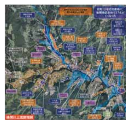
地域で協力して作った「防災マップ」

「マップづくりのため、地区で3回集まり、過去に災害が起きたり災害の予兆現象が見られたりした場所、避難場所などの情報を出し合い、自主避難のルールを定めました。」