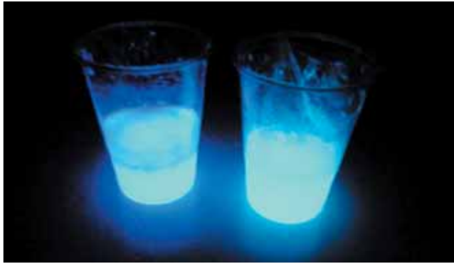
暗闇で光るスライム

日程 6月9日、23日、30日(いずれも土曜日) 時間 午後2時～3時(受け付けは1時30分から) 会場 県立自然史博物館(富岡市上黒岩) 内容 自然界には、暗闇で体から光を発生する発光生物という生き物がいます。発光生物について学習した後、蓄光パウダーを使ったスライムを作ります。 講師 当館職員、ボランティア 対象 小学生以上の人 ※小学3年生以下は保護者の付き添いが必要 定員 30人(先着順) 費用 無料 申し込み方法 当日、直接会場にお越しください 問 ☎0274・60・1200 FAX 0274・60・1250