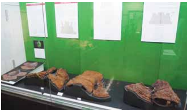
防食処理後初めて公開された実物の甲

埋蔵文化財調査事業団 最新情報展「甲を着た古墳人の武器・武具」ギャラリートーク 期日 7月1日(日) 時間 午後1時30分～3時 会場 県埋蔵文化財調査センター発掘情報館(渋川市北橋町) 内容 金井東裏遺跡から発見された「甲を着た古墳人」が装着していた