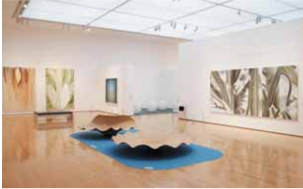
作品が展示された会場風景

期日 6月9日(土) 時間 午後2時～2時40分 会場 県立館林美術館(館林市日向町) 内容 特別展示「アート遊覧紀行ー自然と人間をめぐってー」の展示作品を、当館学芸員による解説を聞きながら鑑賞します 費用 無料 ※観覧料がかかります 観覧料 一般140円、大学・高校生200円、中学生以下110円 申し込み方法 当日、直接会場にお越しください 問 ☎0276・72・8188 FAX 0276・72・8338