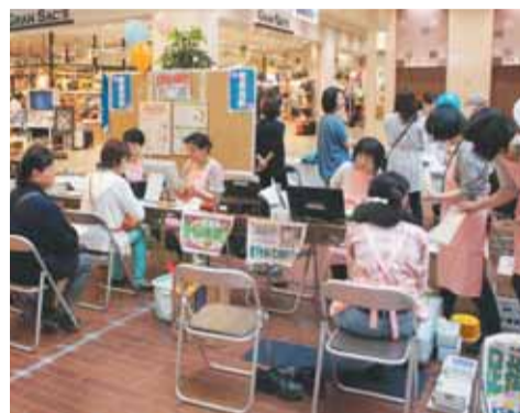
健康に関する相談コーナー

入場料 無料 問 県庁医務課(☎027・2226・2538 FAX027・2233・0531)