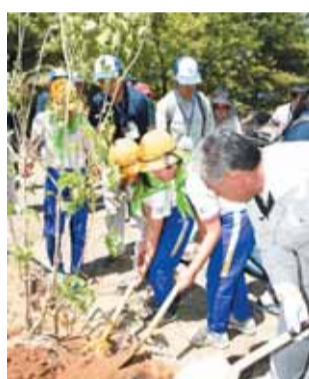
緑の少年団による記念植樹

テーマ この両手 緑増やす手 支える手 内容 式典、記念植樹、地元特産品や木工品などの展示・販売など 費用 無料 申し込み方法 当日、直接会場にお越しください その他 ・植樹作業に適した服装や履物でお越しください ・会場周辺は混雑が予想されます。時間に余裕を持ってお越しください 問 県庁緑化推進課(☎027・2226・3272 FAX027・2230・0154)