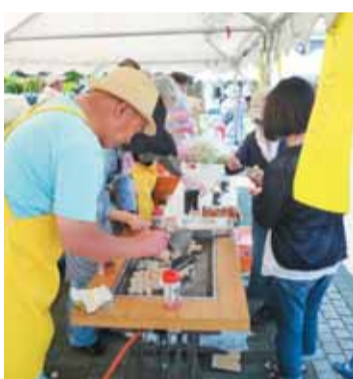
こんやくステーキの試食

期日 5月26日(土) 時間 午前10時30分～午後4時 会場 道の駅「らん藤岡(藤岡市中)」 内容 こんやくを使った料理の試食や製品販売、手作り体験教室、料理レシピ集などの配布、資料の展示、種芋の無料配布 ※こんやく製品を購入した人の中から抽選で景品を差し上げます ※種芋の無料配布は数に限りがあります