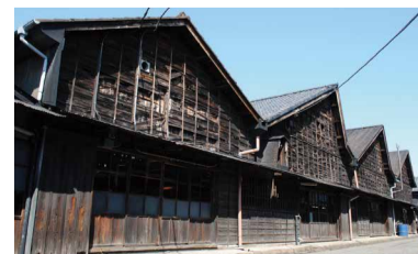
日本遺産の構成文化財の一つ後藤織物（桐生市）