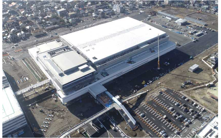
△ 敷地上空からの工事の様子（会議・展示施設）