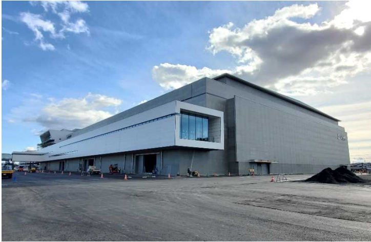
△ 建物北西側の外観と舗装工事の様子

建物周囲の舗装工事を進めています。建物内部では、展示ホールの可動間仕切り壁設置などの内装工事や各種設備工事の作業を急ピッチで進めています。