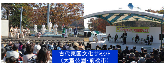
古代東国文化サミット (大室公園・前橋市)