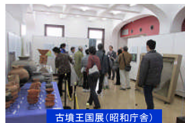
古墳王国展(昭和庁舎)