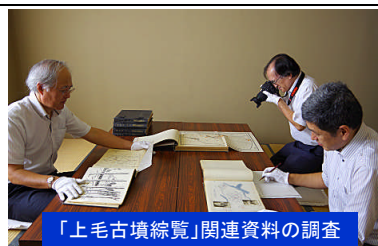
「上毛古墳総覧」関連資料の調査