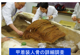
甲着裝人骨の詳細調査