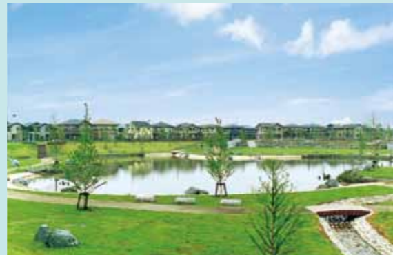
板倉ニュータウン内ふれあい公園