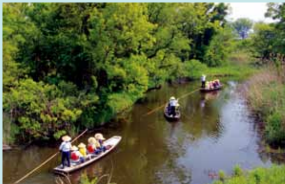
揚舟 谷田川めぐり