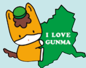
群馬県のマスコット 「ぐんまちゃん」