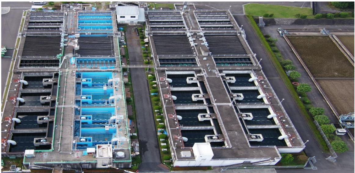
県央第一水道事務所