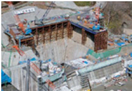
ハッ場発電所建設現場