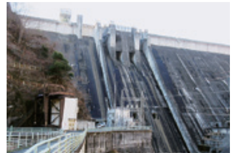
下久保発電所と下久保ダム