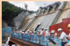
昨年のハッ場発電所建設現場を見学する様子