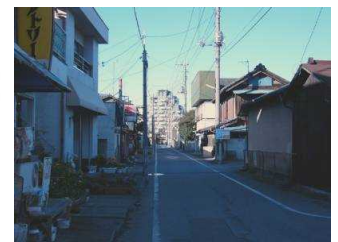
⑦車両のすれ違いのできない道路