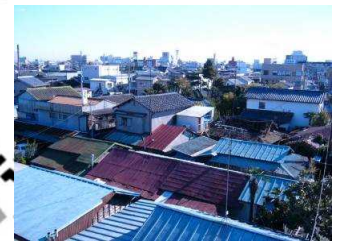
⑤密集する老朽住宅