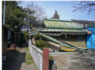
①老朽化した空き家