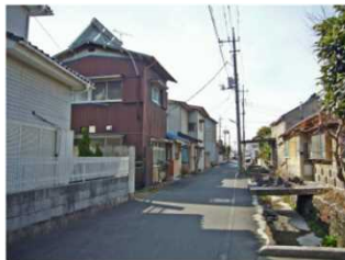
②狭い道路に面する住宅