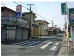
③歩道のない道路に面する住宅