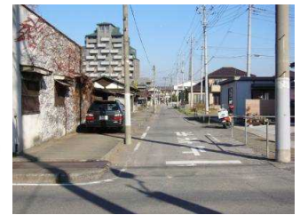
⑥狭い道路と市街地市営住宅