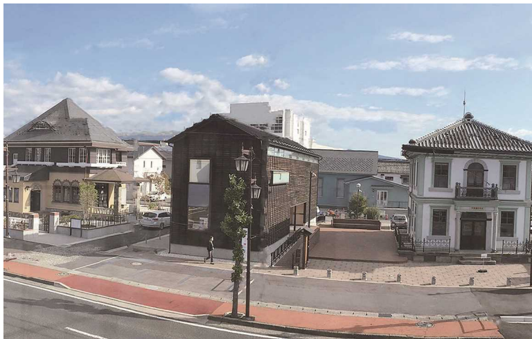
大正ロマンエリア街並み

このような状況から沼田市では中心市街地にかつてのにぎわいを取り戻すため、市役所が入る複合施設「テラス沼田」などが並ぶ本町通り上之町周辺(以下、大正ロマンエリア)で、土地区画整理事業にあわせ、沼田市にゆかりのある大正期の歴史的建造物4棟を核とした、いわゆる「大正ロマン」をイメージしたまちづくりを進めています。