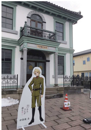
「はいからさんが通る」パネル

他にもお土産品として「はいからさんが通る」のアニメキャラクターがデザインされた缶バッジを旧沼田貯蓄銀行で販売しています。