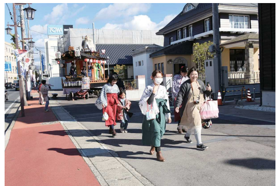
「大正風の袴体験」のようす