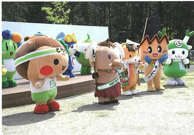
ゆるキャラだよ！全員集合