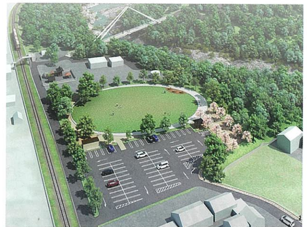
「はねたき広場」基本計画鳥瞰図