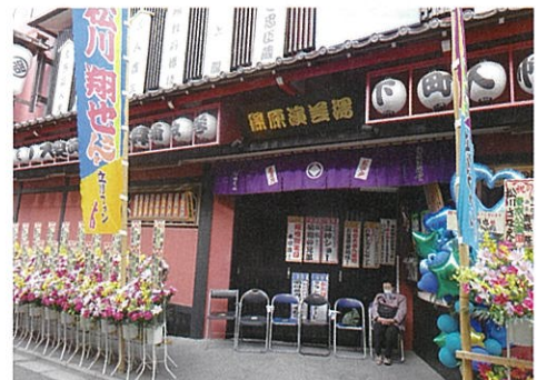
昭和26年に開館した「篠原演芸場」。十条中央商店街の人情の象徴ではないでしょうか。

十条銀座通りを少し歩くと「篠原演芸場」があります。昭和26(1951)年に開館し東京で最も古い本格劇場で、現在は都内に三軒しかない大衆演劇専門の劇場です。地元民に愛され地域に根づいており、平成10(1998)年には十条の中央商店街という名前を演芸場通りに変更した程。時代劇、剣劇、人情劇と芝居の幅は広く是非一度足を運んでいただきたい場所です。