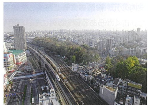
北とびあの展望台からみた飛鳥山。将軍・吉宗も見ることのできなかった俯瞰景。鉄分濃度の高い人は、ジオラマをみているような気分に……。

エリア毎に特徴がある北区。まさに、“このまちの一步奥へ”の意味がわかった気がした一日でした。また、別の北区にふれてみたい……次は、田端、鉄道・都電、そしてやはり赤羽の赤提灯での“おでんと出汁割り”でしょうか!?