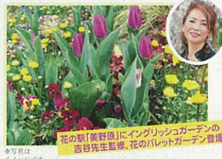
中之条は イングリッシュ

花の駅「美野原」にイングリッシュガーデンの 吉谷先生監修、花のバレットガーデン登場!