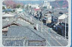
桐生新町重伝建地区