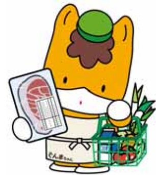
食品表示ぐんまちゃん