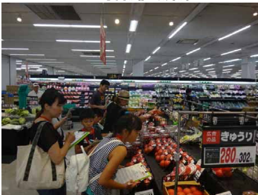
↑ベイシア西部モール店での様子

冷蔵品コーナー：「期限」、どのような商品に「賞味期限」と「消費期限」のどちらが書いてあるか。