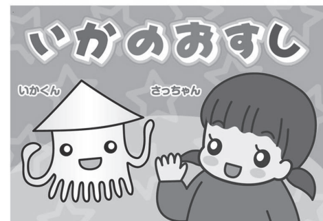
(協力:kirakira イラスト:山口美那枝)

県や県警察では、防犯に役立つ動画を作成して県公式YouTubeチャンネル「tsulunos」で公開しています。ぜひご覧ください。