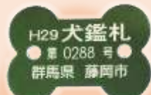
鑑札・注射済票の例。 市町村により形は異なります。

犬の場合、市町村への登録の際に「鑑札」、 狂犬病予防注射時に「 注射済票 」が交付されます。 これらも迷子札の役割を果たしてくれます。 狂犬病予防法 （第4条第3項、第5条第3項）にも、 これらを犬に装着するように明記されています。