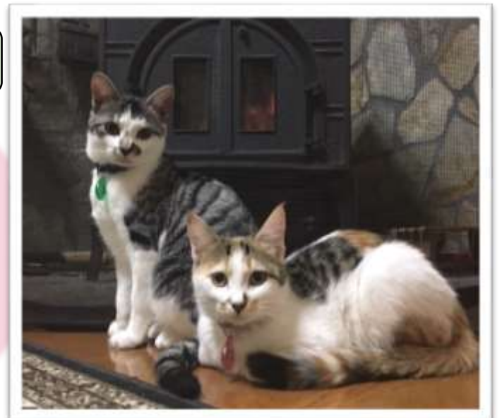
17-F066 高沢けんくん (左)