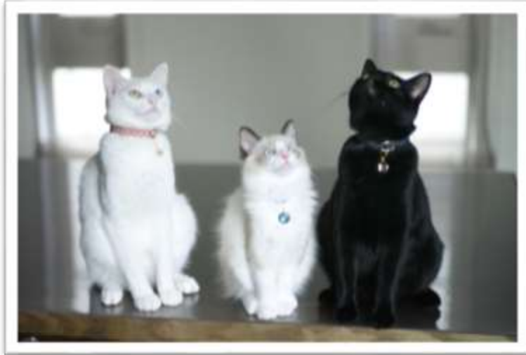
16-F083 諸田ラムちゃん (左)