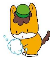
群馬県のマスコット「ぐんまちゃん」