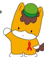
群馬県のマスコット「ぐんまちゃん」