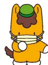
群馬県のマスコット 「ぐんまちゃん」

★ 県内のインフルエンザの詳細情報はこちら: http://www.pref.gunma.jp/02/p07110015.html