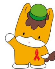
群馬県のマスコット「ぐんまちゃん」

http://www.pref.gunma.jp/02/d2900269.html