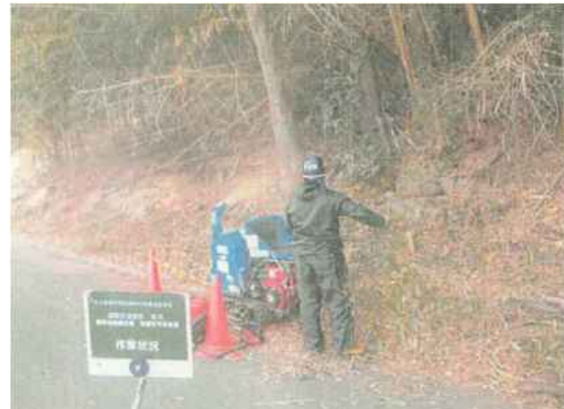
平成30年度沼田市内竹粉碎機利用状況

事業名:竹粉碎機購入事業 事業実施主体:沼田市 事業内容:竹粉碎機の購入 目的:放置竹林の一層の整備促進を図るため、竹粉碎機を整備する。 事業費:4,713,544円 県補助金:2,356,000円 市負担金:2,357,544円 基金事業実施箇所のみならず、広く活用するため独自提案事業とする