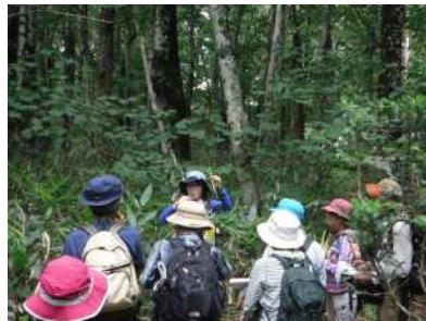
フォローアップ研修