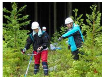
森林ボランティア体験