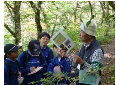
「緑のインタープリター」 の活動状況