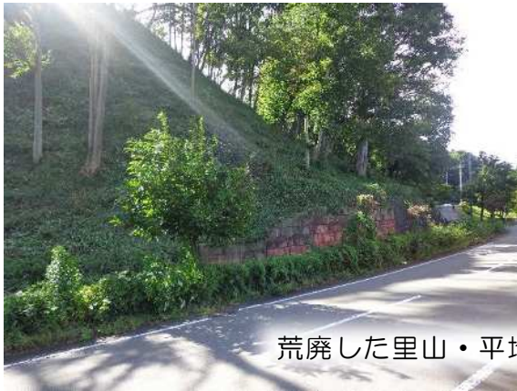
荒廃した里山・平地林の整備（みなかみ町）