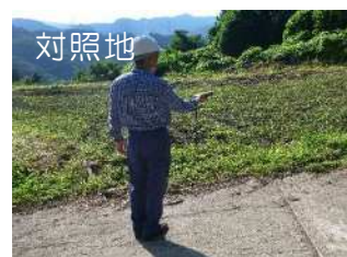
相対照度測定の様子