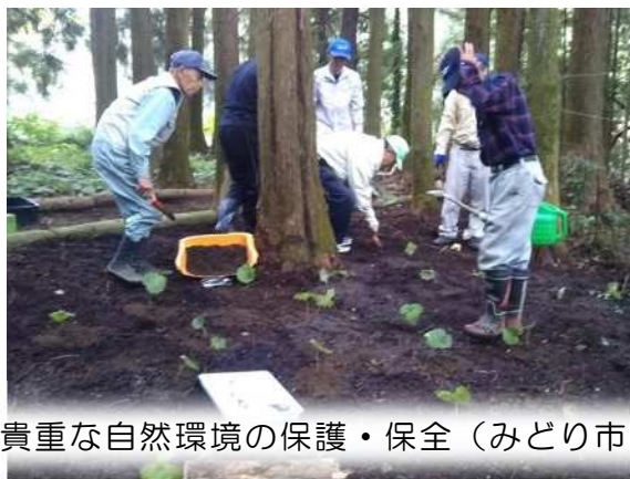
貴重な自然環境の保護・保全（みどり市）