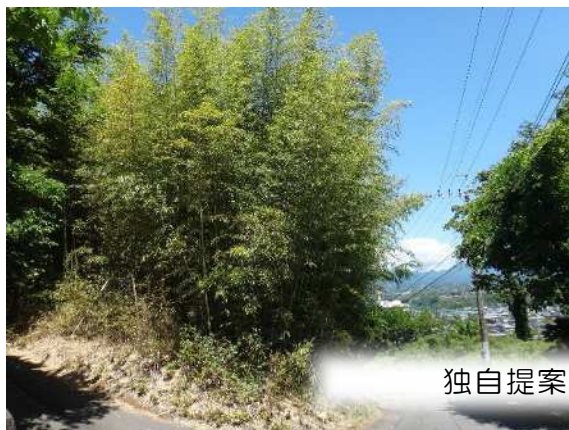
独自提案事業（高崎市）