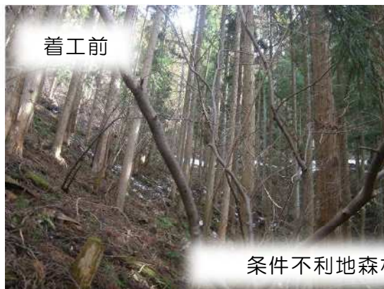
条件不利地森林整備 (藤岡市)