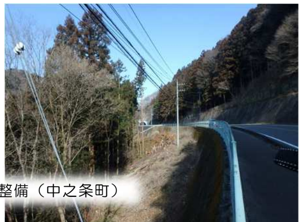
荒廃した里山・平地林の整備（中之条町）