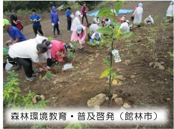
森林環境教育・普及啓発（館林市）