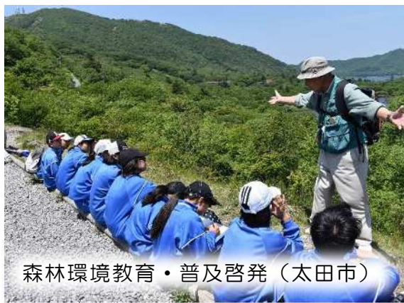
森林環境教育・普及啓発（太田市）