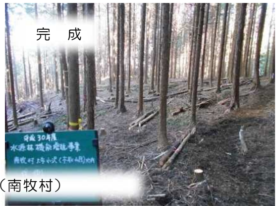
水源林機能増進（南牧村）