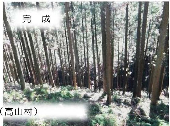
水源林機能増進（高山村）