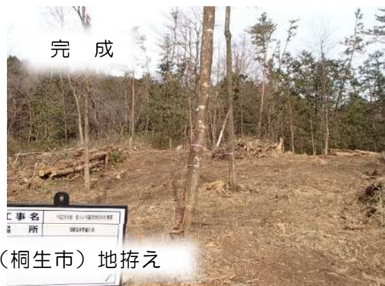
松くい虫被害地の再生（桐生市）地拵え