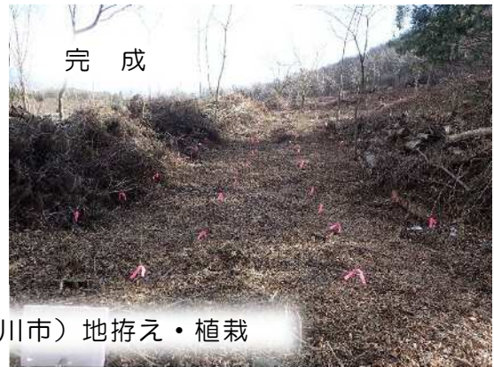
松くい虫被害地の再生（渋川市）地拵え・植栽