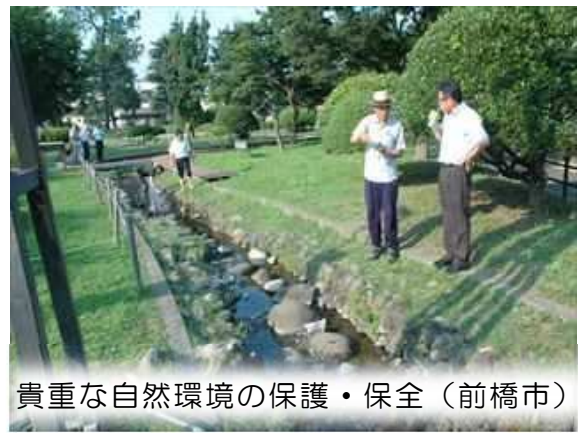
貴重な自然環境の保護・保全（前橋市）