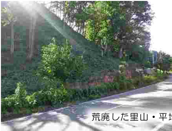
荒廃した里山・平地林の整備（みなかみ町）