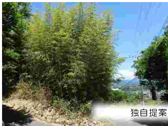
独自提案事業（高崎市）