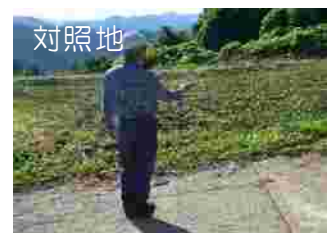
相対照度測定の様子