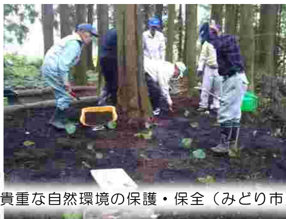
貴重な自然環境の保護・保全（みどり市）