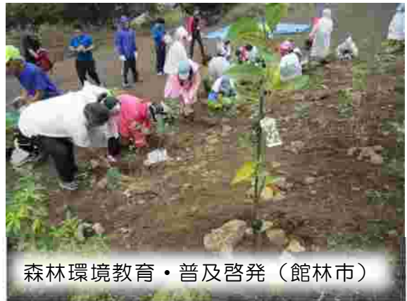
森林環境教育・普及啓発（館林市）