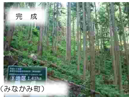
条件不利地森林整備 (みなかみ町)