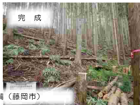
条件不利地森林整備 (藤岡市)