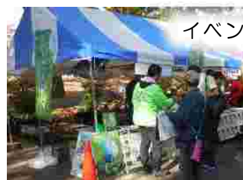
イベントへの出展