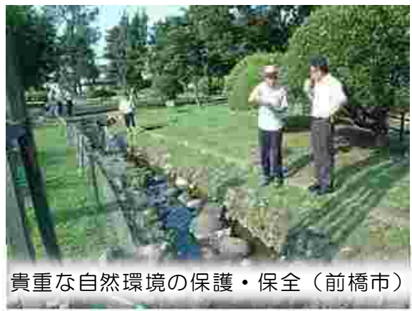
貴重な自然環境の保護・保全（前橋市）