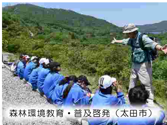
森林環境教育・普及啓発（太田市）