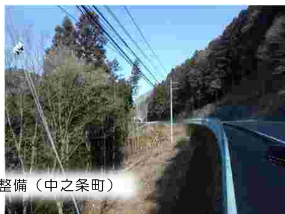
荒廃した里山・平地林の整備（中之条町）