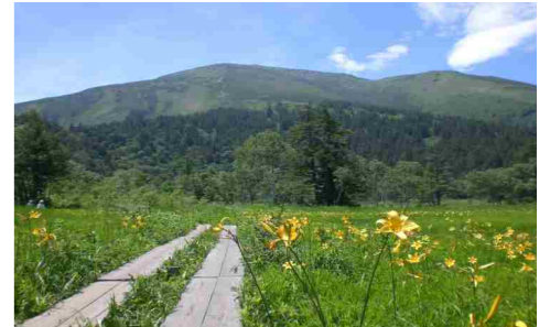
尾瀬ヶ原と至仏山

群馬県『企業参加の森林づくり』は、社会貢献として森林づくり活動をしたいと考える 企業や団体 のみなさんと、自らの手ではなかなか手入れのできない 森林所有者 のみなさんの間を、 群馬県 が橋渡しをして、緑豊かな 群馬県 の森林を守り育てていく取り組みです。