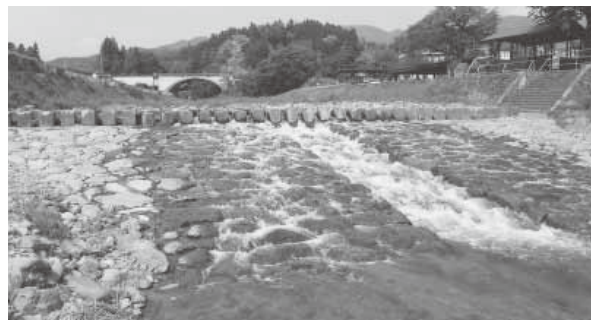
一級河川薄根川 川場村

十分確保することによって、河川が有している自然の復元力を活用できるよう配慮し、約4.0kmの多自然川づくりを実施しました。