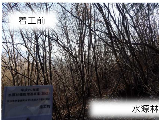
条件不利地等の森林整備（みどり市）