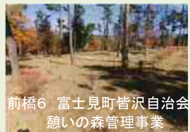
前橋6 富士見町皆沢自治会 憩いの森管理事業