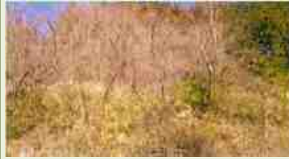
神流4・5 気奈沢地内 森林管理作業