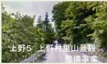
上野5 上野村里山景観 整備事業