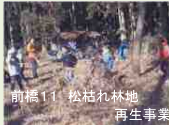
前橋11 松枯れ林地 再生事業