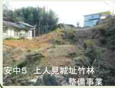
安中5 上人見城址竹林 整備事業