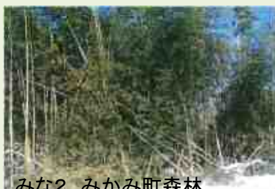
みな2 みかみ町森林 整備事業(野田原地区)