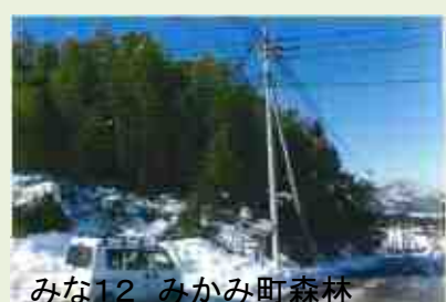
みな12 みかみ町森林 整備事業(上原地区)