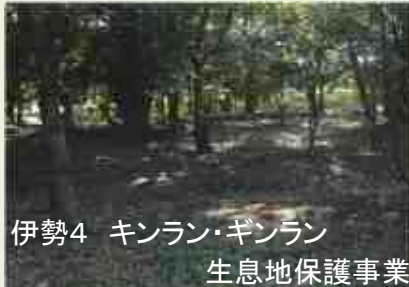
伊勢4 キンラン・ギンラン 生息地保護事業