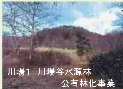
川場1 川場谷水源林 公有林化事業