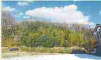
長野原3 草木原地区竹林 整備事業(整備)