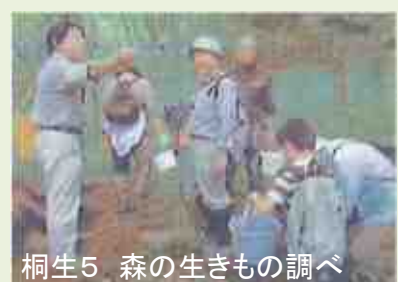
桐生5 森の生きもの調べ