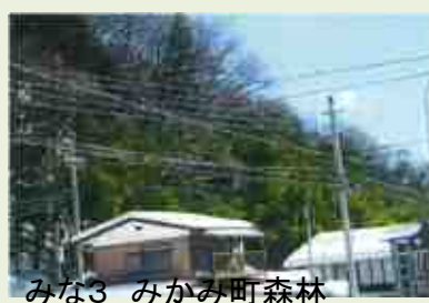
みな3 みかみ町森林 整備事業(今宿地区)