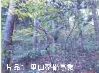
片品1 里山整備事業