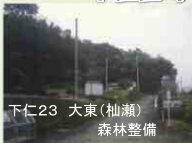
下仁23 大東(杣瀬) 森林整備