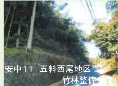
安中11 五料西尾地区 竹林整備事業