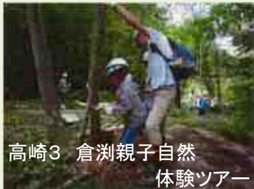
高崎3 倉渕親子自然 体験ツアー