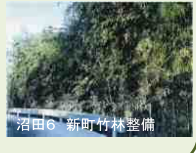
沼田6 新町竹林整備