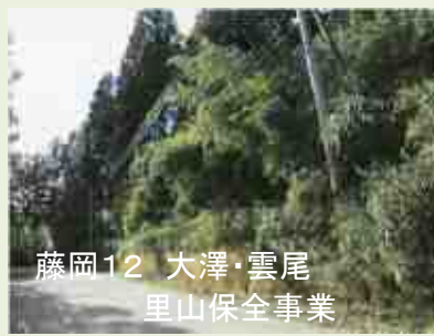
藤岡12 大澤・雲尾 里山保全事業