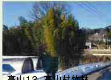
高山12 高山村竹林 整備事業