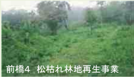
前橋4 松枯れ林地再生事業