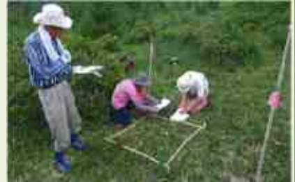
嬭恋6 高山蝶保護活動 支援事業