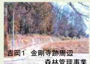
吉岡1 金剛寺跡周辺 森林管理事業