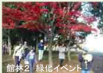
館林2 緑化イベント