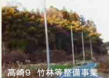
高崎9 竹林等整備事業