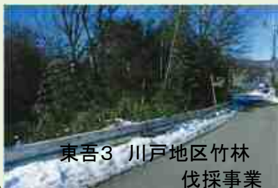
東吾3 川戸地区竹林 伐採事業