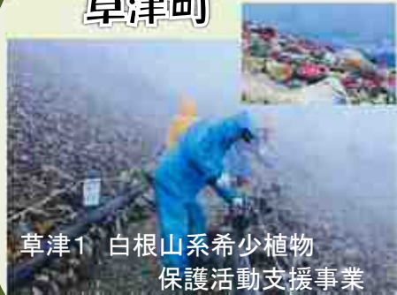
草津1 白根山系希少植物 保護活動支援事業