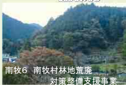
南牧6 南牧村林地荒廃 対策整備支援事業