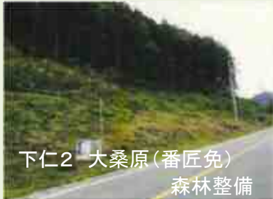
下仁2 大桑原(番匠免) 森林整備