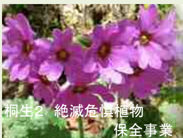
桐生2 絶滅危惧植物 保全事業