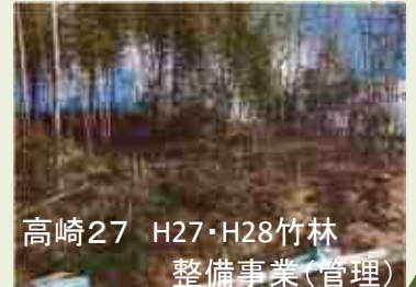
高崎27 H27・H28竹林 整備事業(管理)