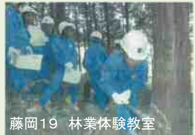
藤岡19 林業体験教室