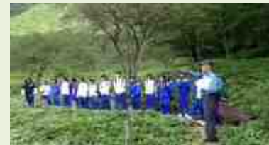
大泉1 森林環境教育