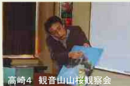
高崎4 観音山山桜観察会