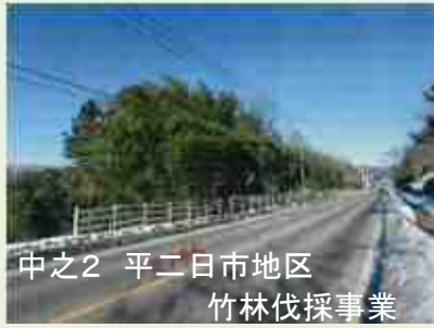
中之2 平二日市地区 竹林伐採事業