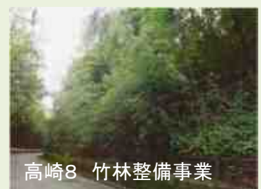
高崎8 竹林整備事業