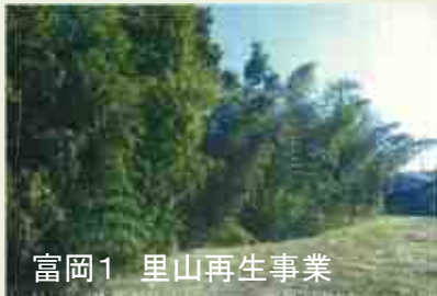
富岡1 里山再生事業