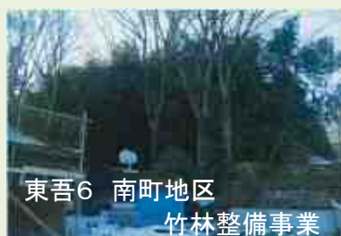
東吾6 南町地区 竹林整備事業