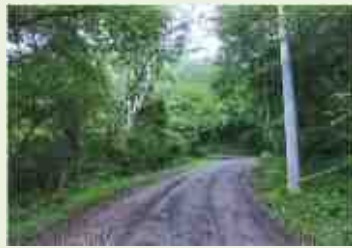
嬭恋1 鎌原姥ヶ原 森林整備事業