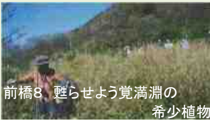
前橋8 甦らせよう覚満淵の 希少植物