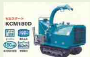
南牧10 南牧村林地荒廃 対策整備支援事業