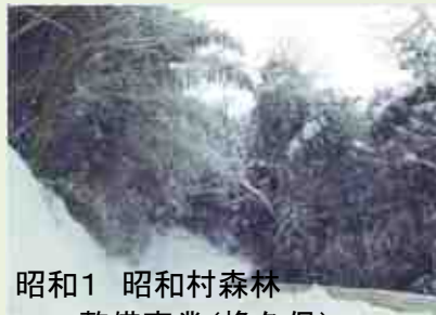
昭和1 昭和村森林 整備事業(椽久保)