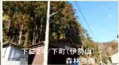
下仁24 下町(伊勢山) 森林整備