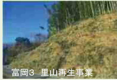
富岡3 里山再生事業