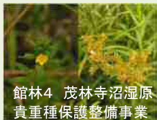
館林4 茂林寺沼湿原 貴重種保護整備事業