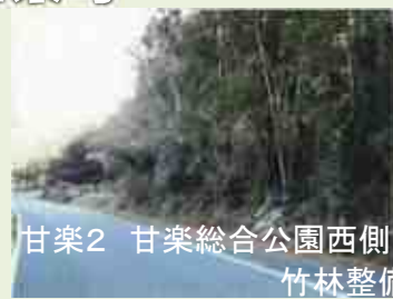
甘楽2 甘楽総合公園西側 竹林整備