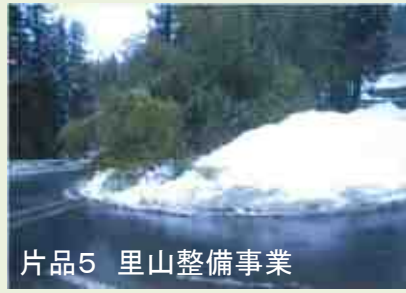
片品5 里山整備事業