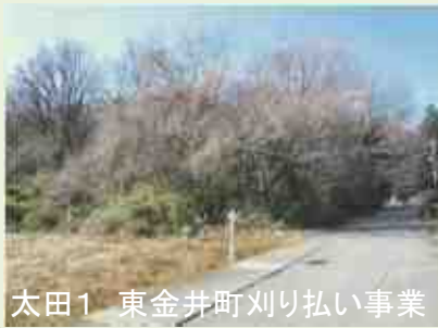
太田1 東金井町刈り払い事業