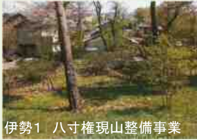
伊勢1 八寸権現山整備事業