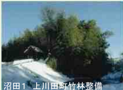
沼田1 上川田町竹林整備