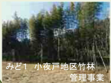
みど1 小夜戸地区竹林 管理事業