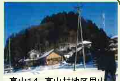
高山14 高山村地区里山 ・平地林整備事業