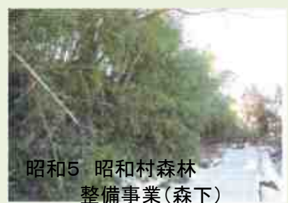
昭和5 昭和村森林 整備事業(森下)