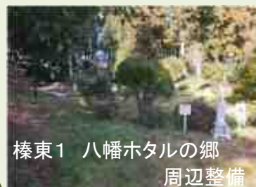
榛東1 八幡ホタルの郷 周辺整備