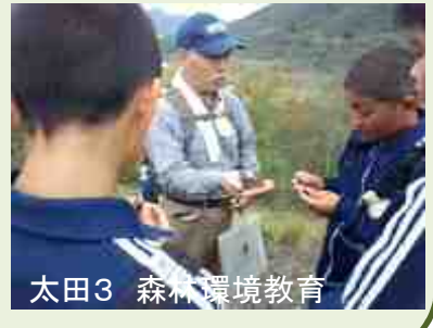
太田3 森林環境教育