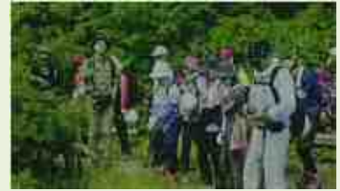
中之6 芳ヶ平湿原周辺 自然観察会