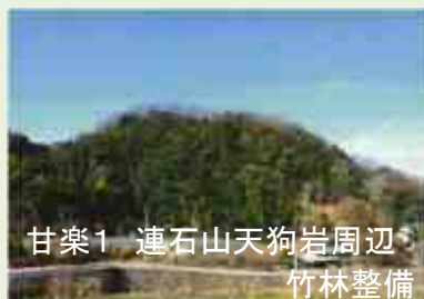
甘楽1 連石山天狗岩周辺 竹林整備