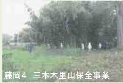
藤岡4 三本木里山保全事業