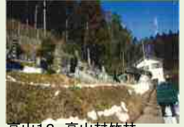
高山12 高山村竹林 整備事業