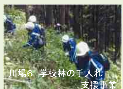
川場6 学校林の手入れ 支援事業