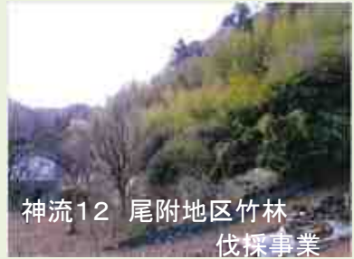
神流12 尾附地区竹林 伐採事業