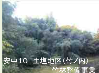
安中10 土塩地区(竹ノ内) 竹林整備事業