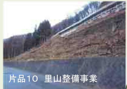
片品10 里山整備事業