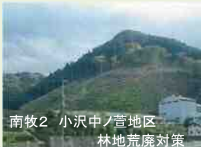
南牧2 小沢中ノ萱地区 林地荒廃対策