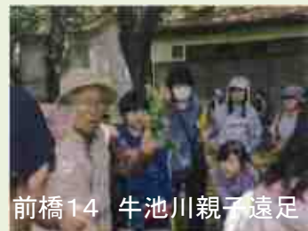
前橋14 牛池川親子遠足