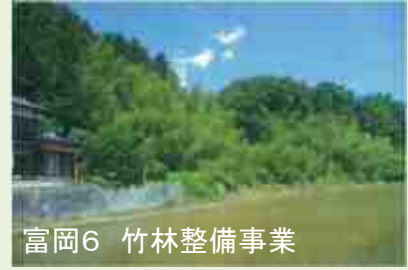
富岡6 竹林整備事業