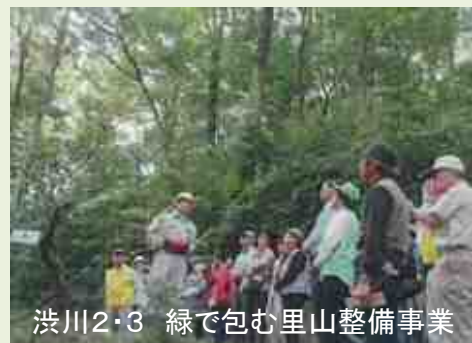
渋川2・3 緑で包む里山整備事業