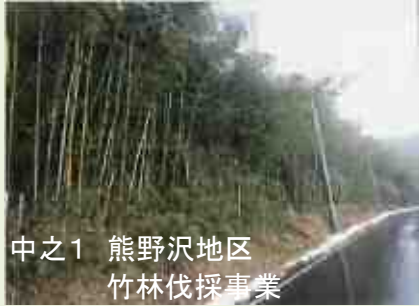
中之1 熊野沢地区 竹林伐採事業