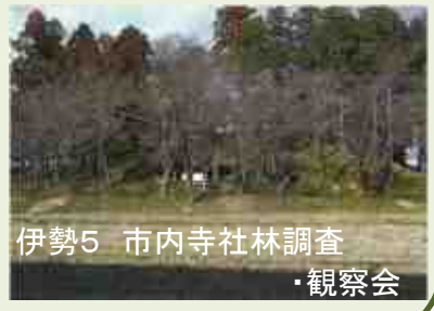
伊勢5 市内寺社林調査 ・観察会