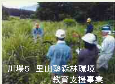
川場5 里山塾森林環境 教育支援事業