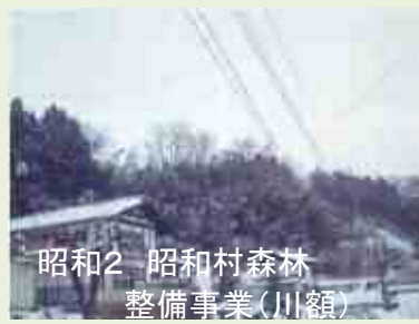
昭和2 昭和村森林 整備事業(川額)