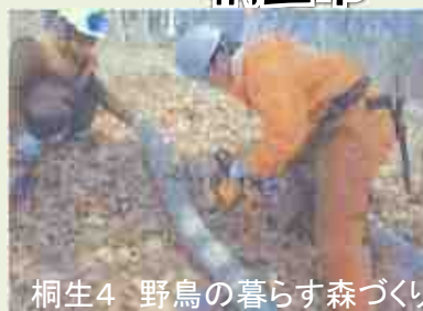
桐生4 野鳥の暮らす森づくり