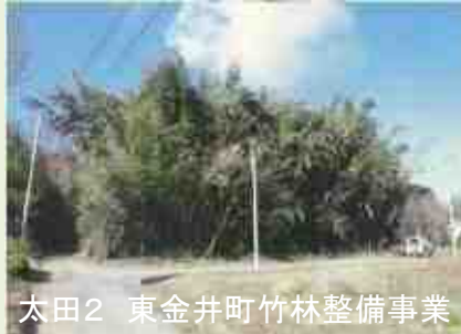
太田2 東金井町竹林整備事業