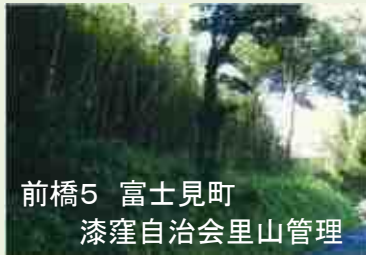
前橋5 富士見町 漆窪自治会里山管理